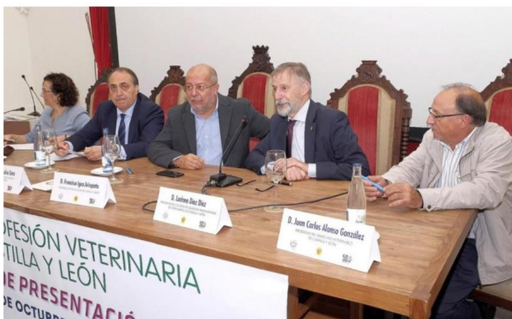
Una imagen de la presentación del Foro de la Profesión Veterinaria de Castilla y León, el pasado mes de octubre.